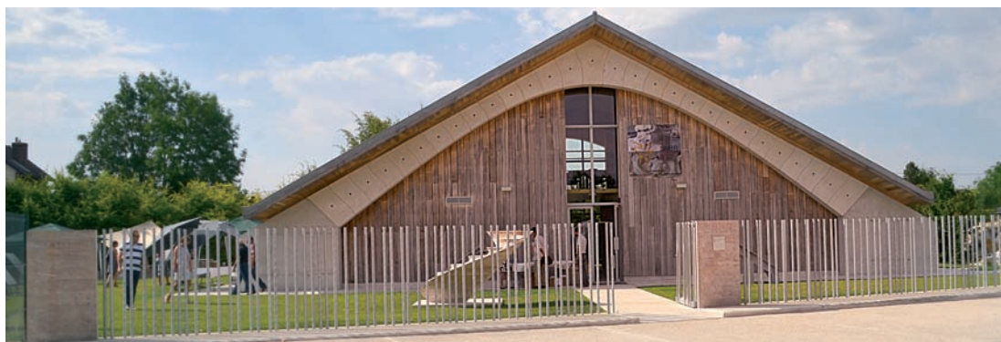
Vue du nouveau bâtiment inauguré par SNBR le 4 juillet dernier. Sous ses arches précontraints, il accueille de nouveaux bureaux et un espace show-room, qui ce jour là a servi de salle de conférence.