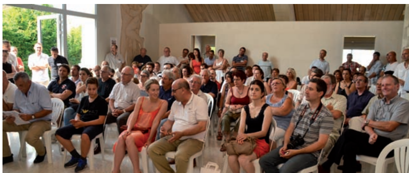
La journée du 4 juillet a réuni de nombreux amis et partenaires professionnels de S.N.B.R.