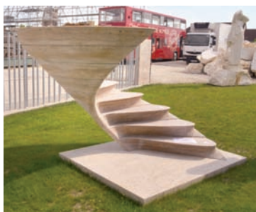
En matière de stéréotomie et de précontrainte, S.N.B.R. dispose d'une expérience et d'un savoir-faire pratiquement uniques en France.