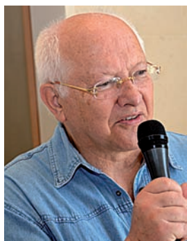
Wojtek Siudmak, sculpteur polonais